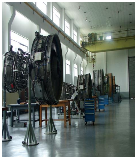
航空发动机维修培训中心