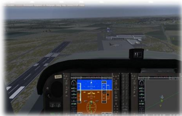
通用航空飞机飞行品质监控平台