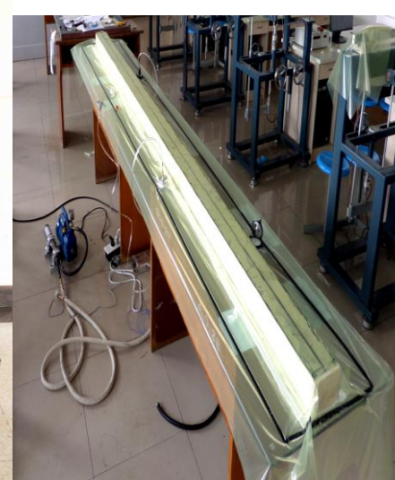
机翼大梁常温真空固化工艺