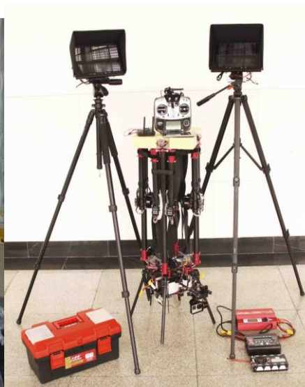
八旋翼重载无人机系统